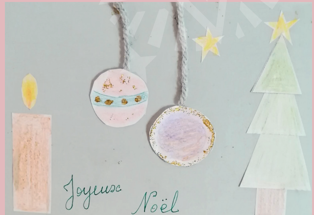
Exemple de carte de vœux.

NB : une idée, tu peux aussi faire pendre les boules à un fil de laine.