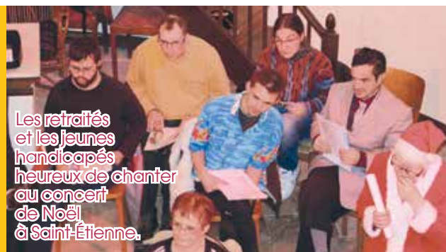
Les retraités et les jeunes handicapés heureux de chanter au concert de Noël à Saint-Étienne.

Quel bonheur de les voir heureux et quelle leçon de vie !