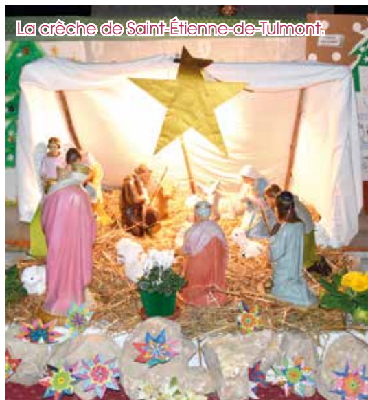
La crèche de Saint-Étienne-de-Tulmont.

« Chaque enfant est une étoile, un éclat de l'infini, Dieu allume des étoiles dans le ciel de notre vie. »