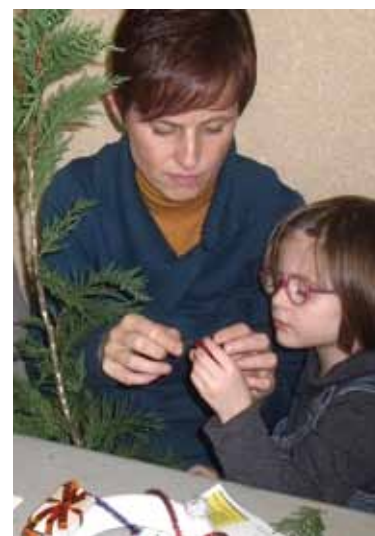
Prendre le temps de jouer avec son enfant.

Le deuxième parent, loin d'être vexé, comprit le message et vint jouer lui aussi avec l'enfant. À quoi bon courir toute la journée s'il devient impossible de perdre du temps avec ceux qui font le centre de notre vie?