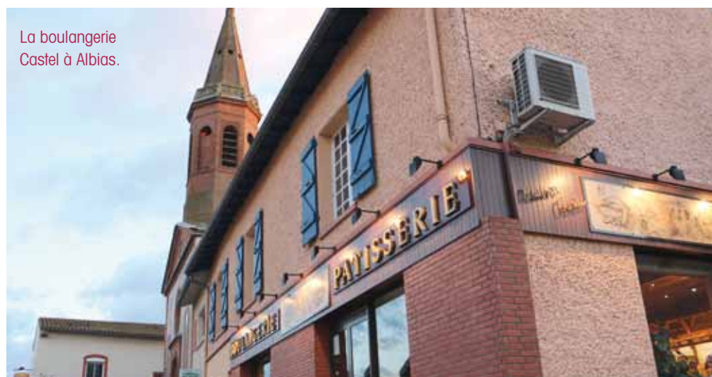
La boulangerie Castel à Albias.

Faire le caramel avec le sucre dans un poêlon (foncer jusqu'à la petite fumée blanche). En même temps, porter la crème fraîche à ébullition dans une autre casserole. Lorsque le caramel est cuit, le retirer du four et verser progressivement la crème jusqu'au mélange total. Rajouter le miel et les noix. Mélanger. Remplir les tartelettes avec la garniture.