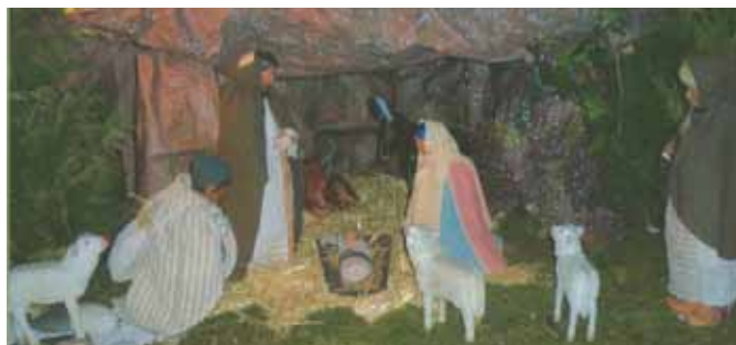
C'est notre foi que l'on donne aux autres.