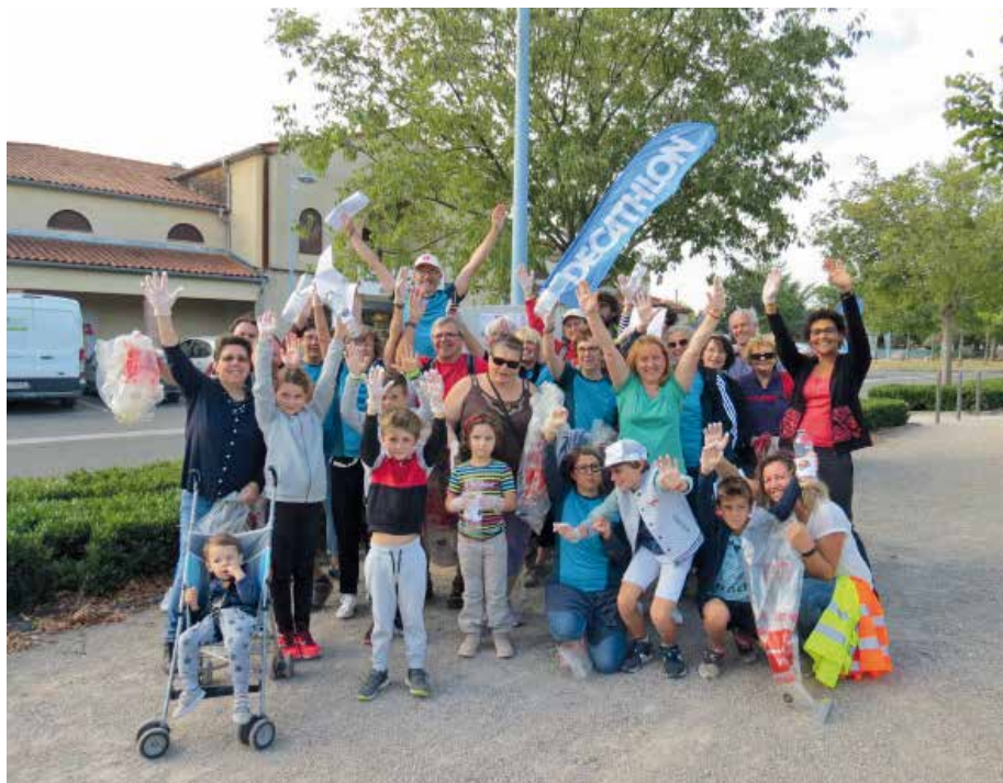
Des citoyens heureux de contribuer au bien-vivre dans leur commune.

Le 21 septembre 2019, l'association Ma Commune et Moi invitait les habitants de la commune de Saint-Étienne-de-Tulmont et de ses environs, petits et grands en partenariat avec Décathlon, Yoann services, Carrefour Contact, AOMC outillages et la municipalité à se joindre au mouvement international du « World clean-up-day », entendez par-là, une journée de mobilisation pour éveiller l'attention sur les déchets sauvages, provoquer une prise de conscience, au travers une collecte organisée en plusieurs petits groupes dans les rues de la commune.